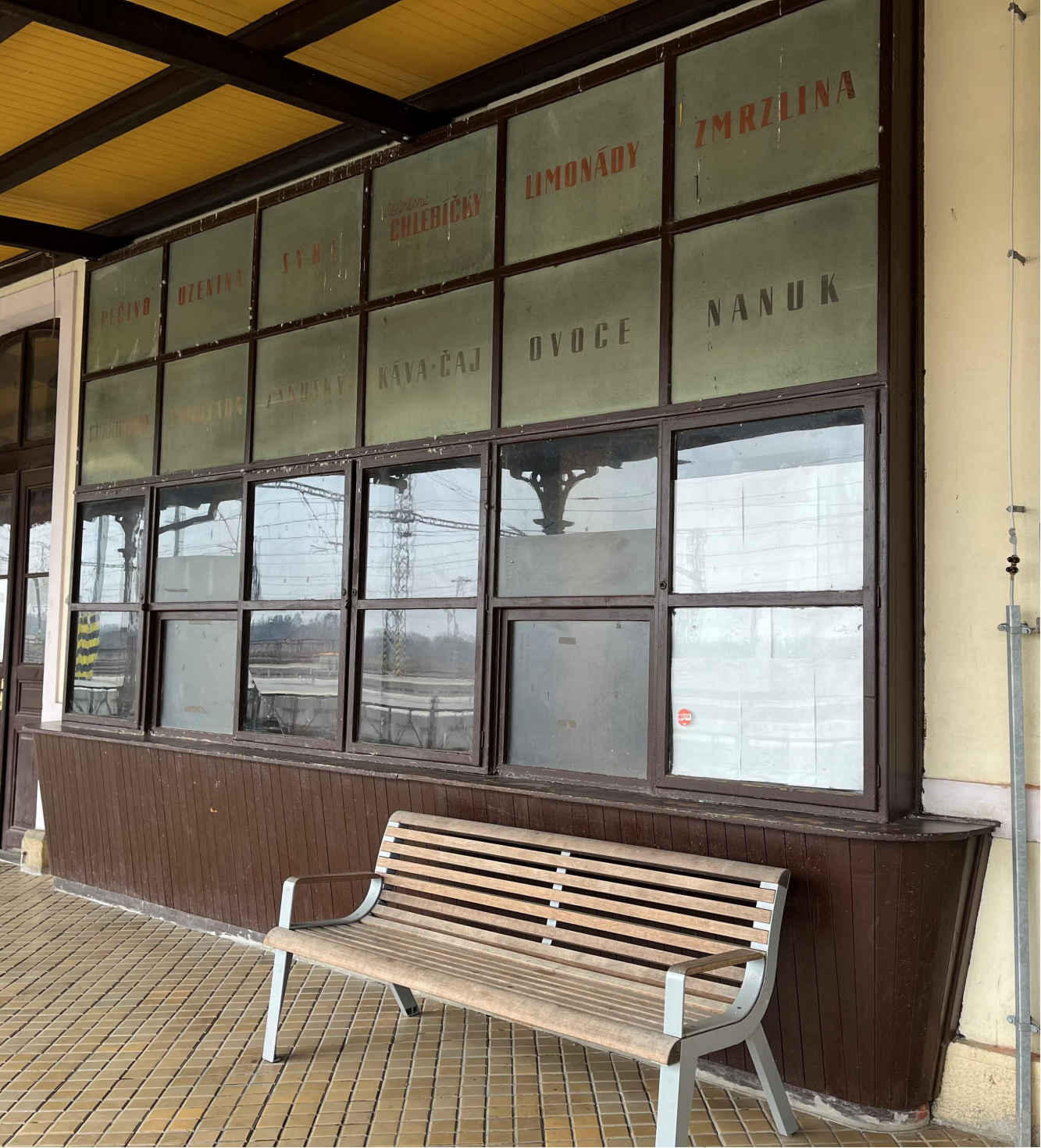
STÁVAJÍCÍ DŘEVĚNÁ KONSTRUKCE NA JIŽNÍ STRANĚ OBJEKTU B Z INTERIÉRU